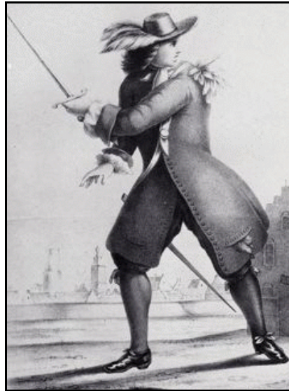
De Friese loskop.

Wiskunde onderwijs kreeg pas gestalte in 1598 na de benoeming van Adriaan Metius (1571 - 1635). Hij gaf naast wiskunde ook zeevaartkunde, landmeetkunde, vestingbouwkunde en sterrenkunde en was door zijn vele publicaties in