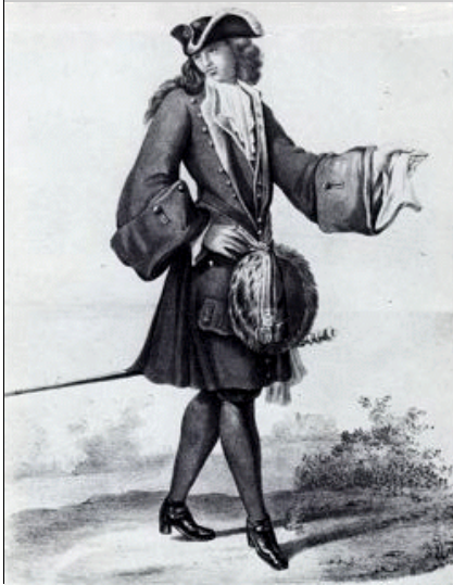
Een Franeker student.

tanus. Door omstandigheden kwam Franeker daarvoor in aanmerking vanwege de gunstige ligging en de grote afstand tot de Spaanse troepen. Daarnaast beschikte het stadsbestuur over het ontruimde Kruisbroedersklooster hetgeen een prima onderkomen