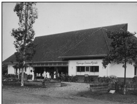
De Koningin Emma Kliniek in Medan.