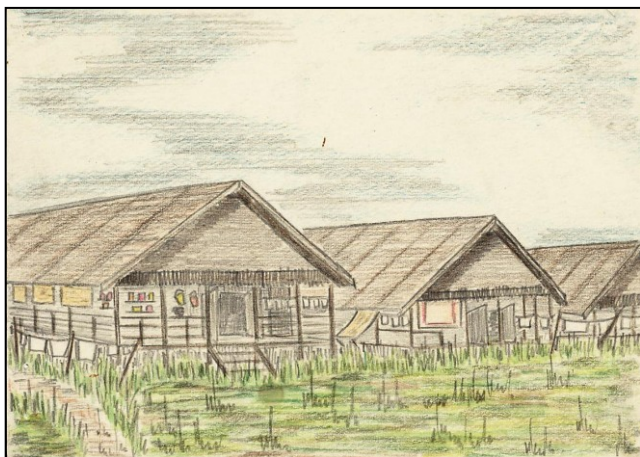
Poeloe Brayan, de hongs 4,3 en 2 van kamp E.

ding van de krijgsgevangenen binnen: gedrukte kaarten, waarop vermeld stond hun gezondheid, soldij enz. Onderaan hadden ze zelf wat mogen schrijven. Deze gebeurtenissen bracht